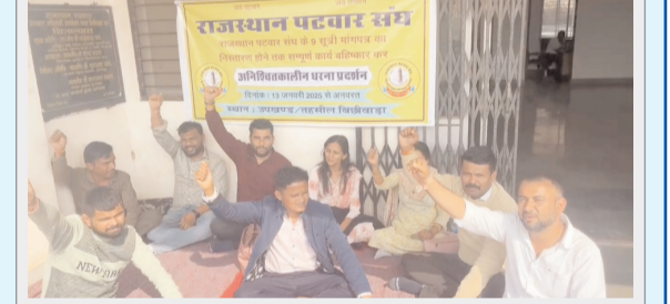
डूंगरपुर। तहसील कार्यालय के बाहर प्रदर्शन करते पटवार संघ सदस्य।

डूंगरपुर (पुकार)। राजस्थान पटवार संघ ब्लॉक बिछीवाड़ा के पदाधिकारी और कार्यकर्ताओं ने आज बिछीवाड़ा तहसील कार्यालय के बाहर धरना देते हुए अपनी 9 सुत्री मांगों को लेकर ज्ञापन सौंपा। ब्लॉक