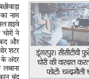
डूंगरपुर। सीसीटीवी फुटेज में कैद चोरी की वारदात करता बदमाश।

चौंकाने वाला मामला तब सामने आया है जब 15 दिन पहले लबाना बस्ती में चोरों ने दो घरों को निशाना बनाकर बेटी की शादी के लिए 85 लाख नकद और सोने-चांदी के गहने चुरा लिए थे।