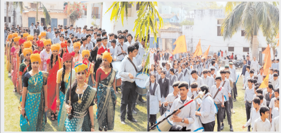
विद्यानिकेतन के विद्यार्थी घोष वादन के साथ कदम से कदम मिला पथ संचलन करते।